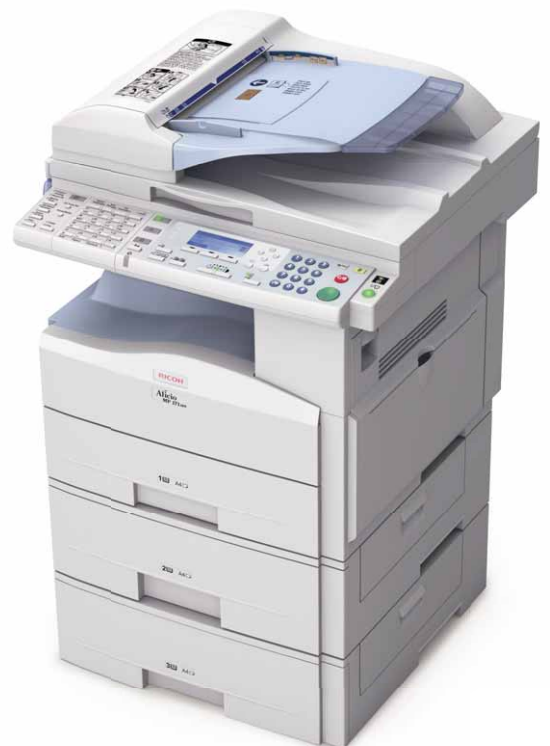
Aficio™ MP 171/MP 171SPF